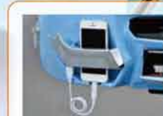
携帯電話の充電が可能 ※2